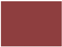
On Stage! 5930