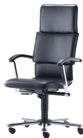
T-C10-A-D1-S aktiivinen lantiotuki korkeussäädöllä varustetut käsinojat hartiatuki GV-teräs kromi