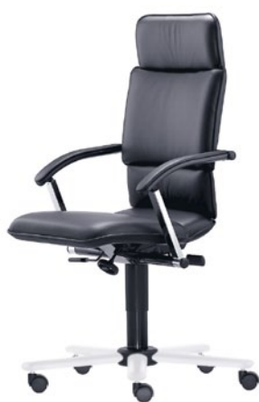
T-C8-A-D1-S aktiivinen lantiotuki korkeussäädöllä varustetut käsinojat hartiatuki LW-teräs alumiini valkoinen

Collection C on pyörivien toimistotuolien maailman huipulla. Muotoilu viestii ylivoimaa ja vakautta. Parhaat materiaalit ja tinkimätön käsityötaito tekevät tuoleista ihanteellisen vaihtoehdon myös johtajien toimistoihin. Tarjolla on ensiluokkaista istuinmukavuutta. Collection C:n muotoilu havainnollistaa aktiivisen lantiotuen toimintaa. Design: Arno Votteler.