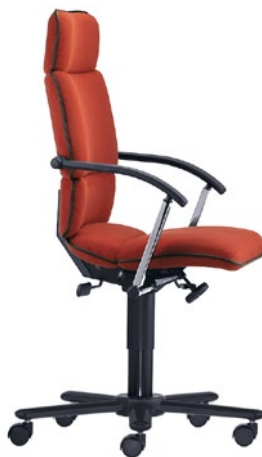
T-C8-A-D1-S aktiivinen lantiotuki korkeussäädöllä varustetut käsinojat hartiatuki LS-teräs musta